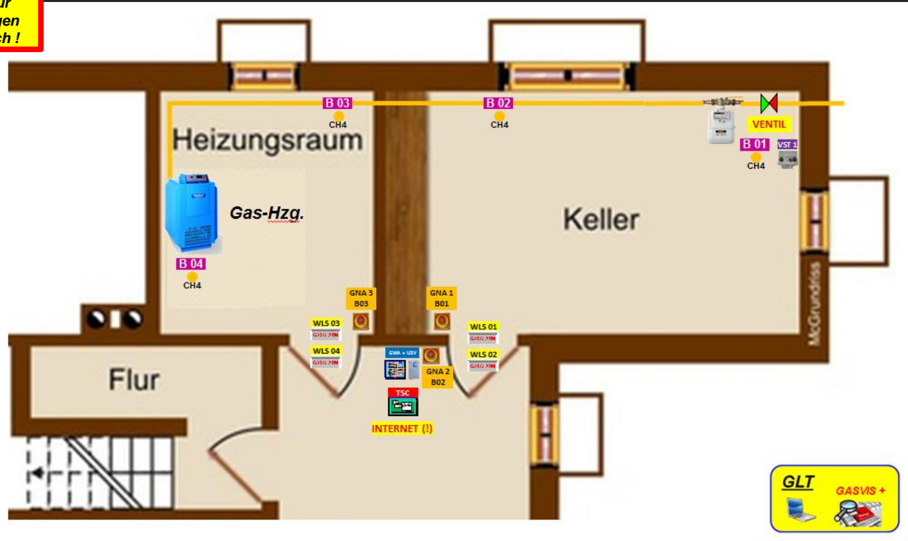
(V1.) Positionsplan _ Musterlösung / Gas-Heizung _ CH4-GWA (Stand: 12.08.16)

Die zus. angesprochene CO Gas-Überwachung, erfolgt in der Regel nur bei großen CH4 Gas-Hzg.