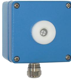
GMF 420 E